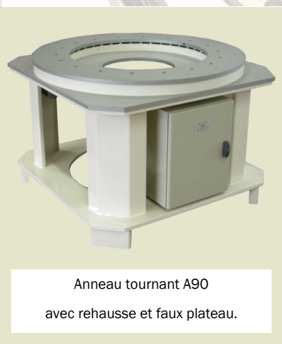
Anneau tournant A90 avec rehausse et faux plateau.