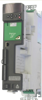
Module de commande

- Pignon d'entrainement à rattrapage de jeu. ◀